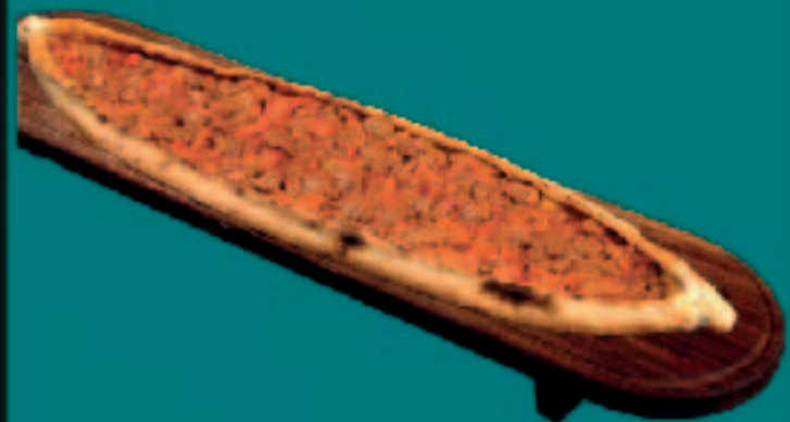
65. PIDE KUSBASI