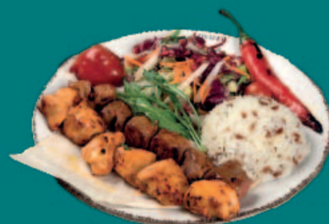
112. LAMM- & HÄHNCHENSPIEB