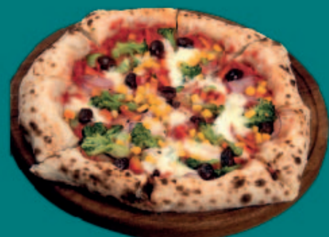
76. PIZZA VEGETARISCH