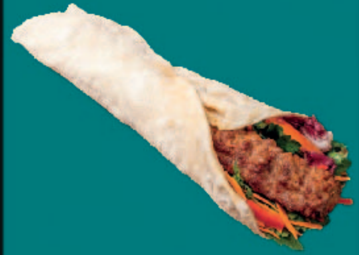
40. ADANASPIEß DÜRÜM

Fladenbrot-Schiffchen mit Knoblauchwurst, Käse & Salat Flatbread-Boats with Garlic Sausage, Cheese & Salad