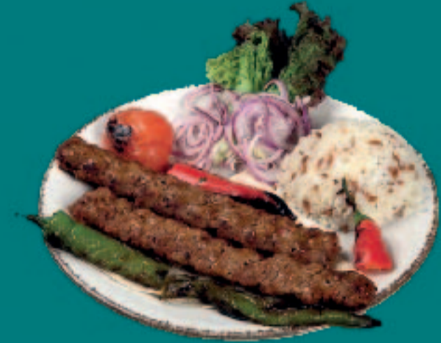
90. ADANA KEBAP