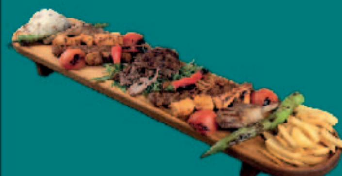
114. GEMISCHTER ZİYAFET GRILLTELLER (2 PERSONEN)