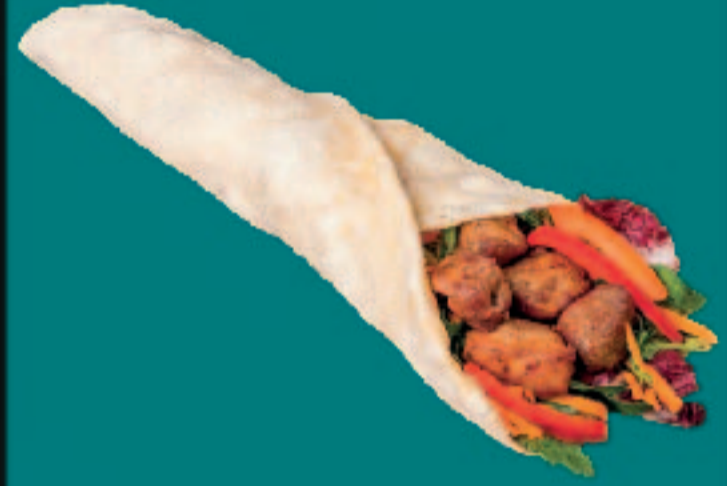
42. LAMMSPIEß DÜRÜM