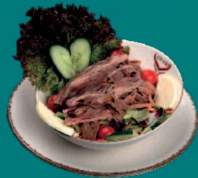
22. STEAK DÖNER SALAT

Dönerfleisch auf Fladenbrotwürfeln mit Tomatensoße, Joghurtsoße, zerlassene Butter & Salat Kebab Meat on flatbread cubes with Tomato Sauce, Yogurt Sauce, melted Butter & Salad