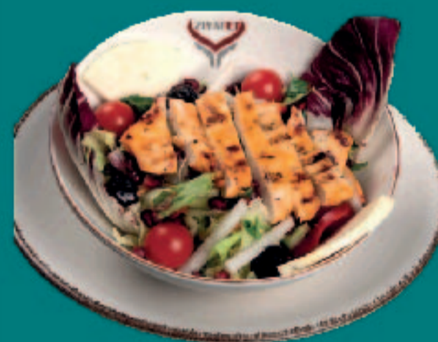
21. HÄHNCHENBRUST SALAT