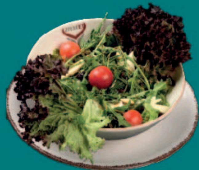
24. RUCOLA SALAT