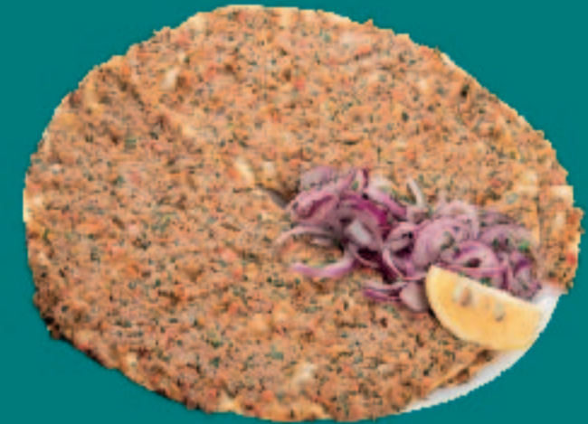
52. LAHMACUN TELLER