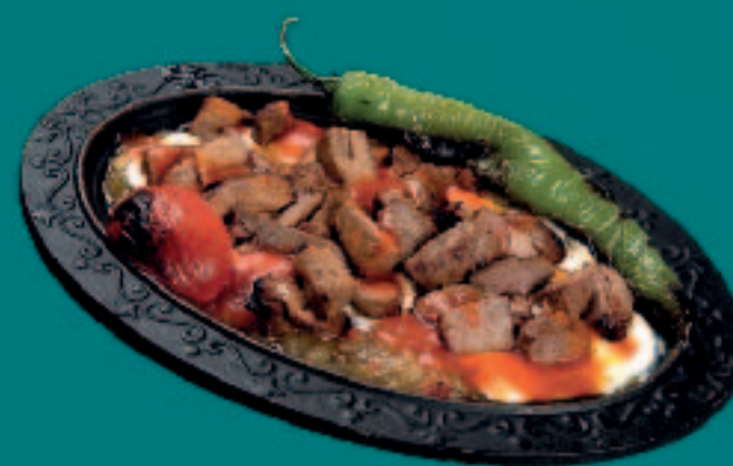
122. ALI NAZIK

Lammfleisch mit Champignons, Tomaten, Zwiebeln, Reis, Lavash Brot & Beilagensalat Lamb with Mushrooms, Tomatoes, Onions, Rice, Lavash Bread & Side Salad