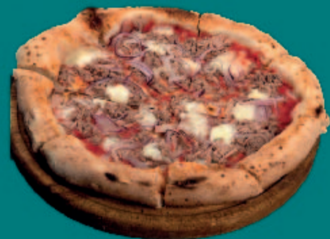
73. PIZZA TONNO