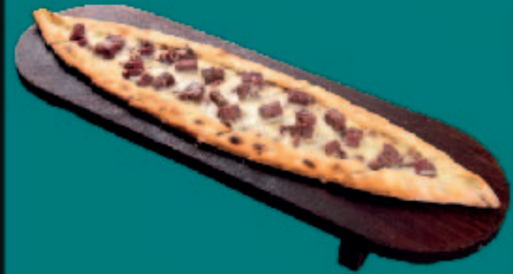
64. PIDE DÖNER

mit Mozzarella, Steak Döner, Zwiebeln with Mozzarella, Steak Kebab, Onions