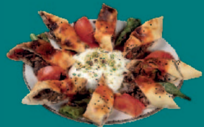
92. GEROLLTE BEYTI KEBAP