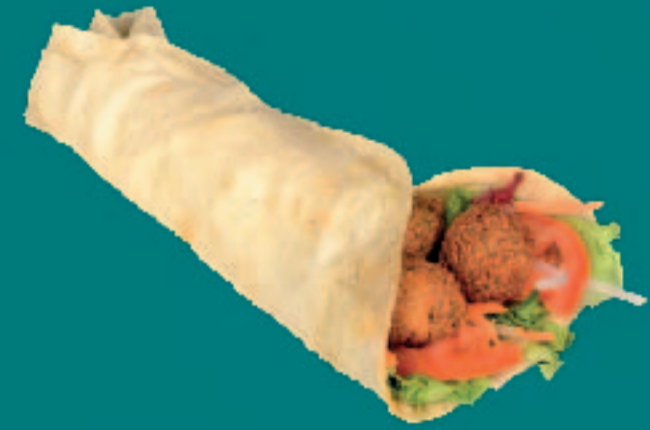
142. FALAFEL DÜRÜM

Eine Portion Pommes One portion of Fries