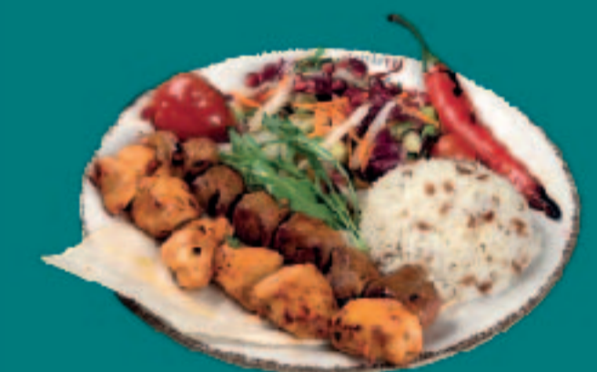
113. GEMISCHTER GRILLTELLER