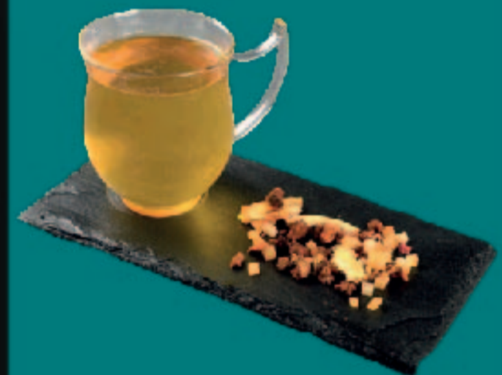
166. TEEPARADIES LÖW