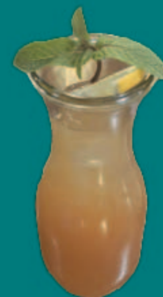
191. HAUSGEMACHTER EISTEE PFIRSICH