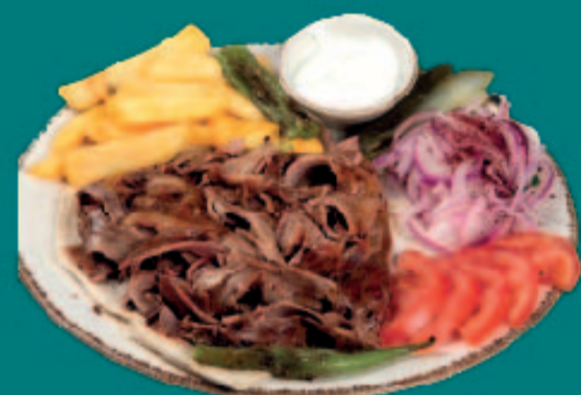
32. STEAK DÖNERTELLER