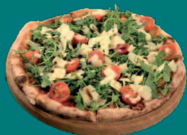
75. PIZZA RUCOLA