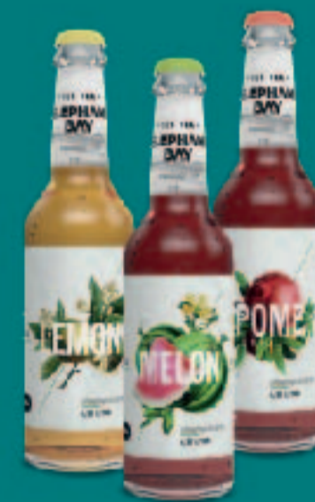
186. ELEPHANT BAY