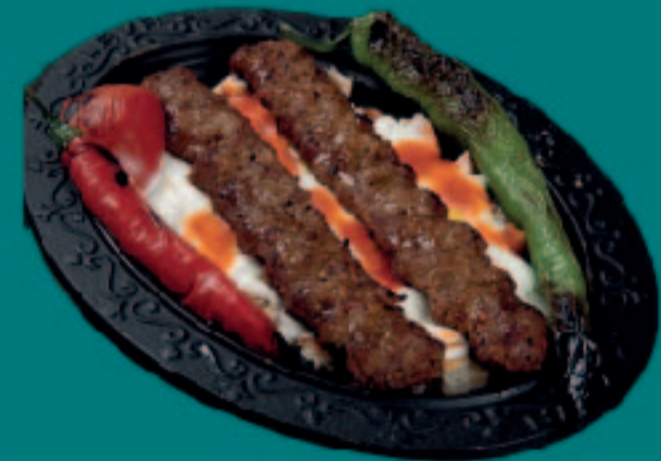
91. JOGHURT ADANA KEBAP