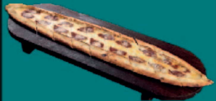
63. PIDE SUCUK